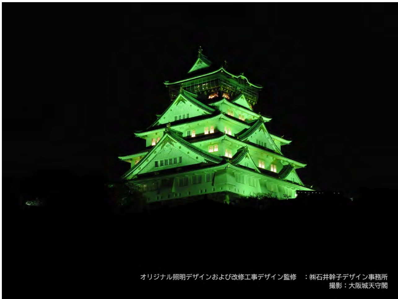
オリジナル照明デザインおよび改修工事デザイン監修：株式会社石井幹子デザイン事務所